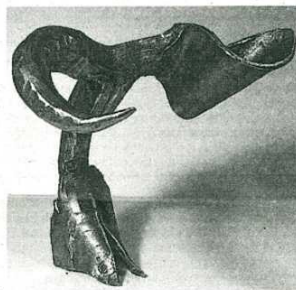
Escultura de F. Gracia-Lasaosa.